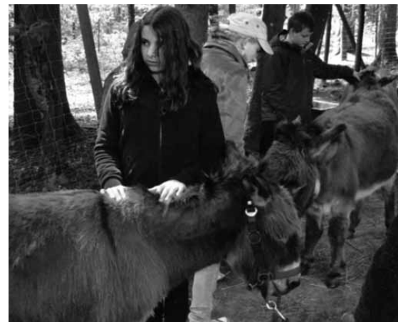
Auch der Umgang mit Tieren kann ein Förderkriterium darstellen. e3 „Unterstützung und Beziehungen“, insbesondere e350 „Domestizierte Tiere“.

In schulischen Begriffen ist der Bezug zur ICF noch in der Entwicklung.