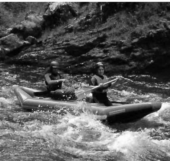
Eine aktive Freizeitgestaltung mit körperlicher Bewegung, geistiger Anregung und Kontakt mit Gleichgesinnten kann förderlich für die Gesundheit sein.

An dieser Stelle beschreibt die ICF, wie die Handlungsfähigkeit durch eine Schädigung oder Störung eingeschränkt sein kann. Z. B. die Schwierigkeit, bei eingeschränkter Merkfähigkeit die Einmaleins-Reihen abzurufen, bei einer eingeschränkten Graphomotorik eine handschriftliche Klassenarbeit mitzuschreiben oder bei einer Sprachentwicklungsverzögerung ein Gespräch zu organisieren.