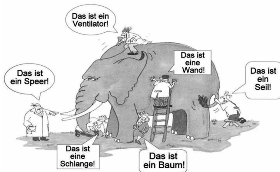
Nach dem südasiatischen Gleichnis „Die blinden Männer und der Elefant“.

Um eine Vergleichbarkeit zwischen einzelnen Fällen herzustellen, sind die Klassifikationen der ICF hierarchisch und alphanumerisch mit Buchstaben und Ziffern gegliedert. Diese Codes erleichtern die Zu- und Einordnung. Die oben vorgestellten Komponenten des ICF-Modells sind in einzelne Kapitel unterteilt. So beginnt die Klassifikation der Körperfunktionen mit Kapitel b1 („Mentale Funktionen“). Ihm folgt Kapitel 2 („Sinnesfunktionen und Schmerz“) usw. Die Kapitel werden zugleich als „Items der ersten Ebene“ bezeichnet. Ihre jeweiligen Inhalte sind in Gruppen zusammengefasst, in Kapitel 1 beispielsweise in die Gruppen „globale mentale Funktionen“ (b110-b139)