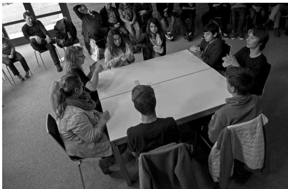
Förderfaktor LERNEN FÖRDERN: Beim Seminar für junge Leute (hier 2014 in Rummelsberg, Bayern) erleben Jugendliche und junge Erwachsene ihre individuellen Stärken, können Kontakte knüpfen, und vieles mehr...